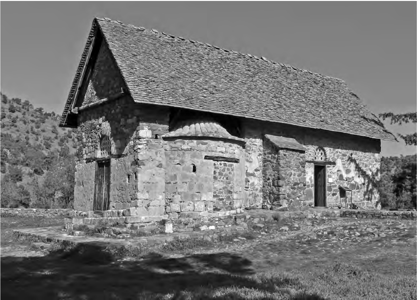
Είκ. 1. Παναγία τῆς Ἀσίνου. Ἐξωτερικό.