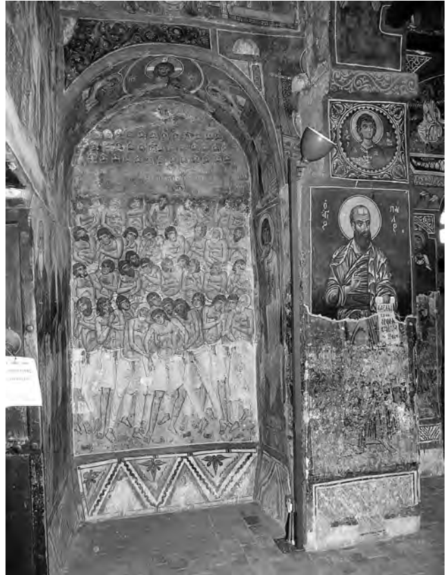
Εἰκ. 4. Παναγία τῆς Ἀσίνου. Ἡ ΒΔ γωνία τοῦ ναοῦ καὶ τὸ φωτιστικό.

Τοποθετήθηκαν δύο φωτιστικά συνολικοῦ ὕψους 2.30 μ. μὲ τὰ ἀκόλουθα χαρακτηριστικά: Τὸ κατακόρυφο στέλεχος τετράγωνης διατομῆς στερεώνεται στὸ μέσον τῆς βάσης. Στὴν κορυφὴ τοῦ στελέχους τοποθετήθηκε μέσω ἀρθρωτῆς σύνδεσης ἡ κεφαλὴ τοῦ φωτιστικοῦ μὲ