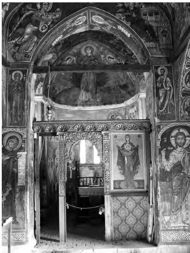
Είκ. 5. Παναγία τής Ἀσίνου. Τὸ ἱερὸ βῆμα τοῦ ναοῦ φωτισμένο με συνδυασμὸ φυσικοῦ καὶ τεχνητοῦ φωτισμοῦ.

ρευόντως τὸ μεσαῖο τμήμα τοῦ ναοῦ καὶ ὁ τρουλλαῖος νάρθηκας. Ὁ συνδυασμὸς φυσικοῦ καὶ τεχνητοῦ φωτὸς (εἰκ. 5) διαχέεται με διακριτικότητα καὶ εὐπρέπεια, καθαρότητα καὶ σιωπὴ σὲ ὁλόκληρη τὴν ἐκκλησία καὶ δημιουργεῖ τὶς κατάλληλες συνθήκες οἱ ὁποῖες ἐπιτρέπουν τὴν ἀπρόσκοπτη θέαση καὶ συμμετοχὴ.